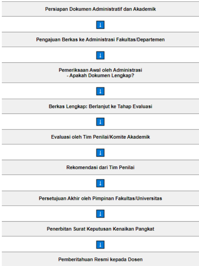
Figure 2 Flowchart Prosedur Pengajuan Kenaikan Pangkat Dosen

Seluruh kegiatan dosen yang meliputi Pendidikan, Penelitian, Pengabdian kepada Masyarakat, Penunjang, serta Kewajiban Khusus sesuai dengan jenjang jabatan akademik wajib dilaporkan melalui Sistem Informasi Sumber Daya Terintegrasi (SISTER). Sistem ini dirancang untuk mendukung proses kenaikan jabatan dosen, khususnya dari Lektor menjadi Lektor Kepala. Dosen diwajibkan untuk mengisi semua komponen kegiatan yang dikenal sebagai Beban Kerja Dosen (BKD), yang kemudian akan dinilai oleh dua asesor setiap semester.